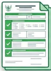
Formulir 1B (Tenaga Kerja Keluar)