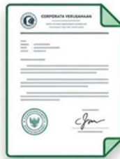
Surat PHK Resmi Dikeluarkan secara resmi dari Perusahaan