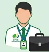
Diserahkan ke Petugas BPJS Ketenagakerjaan Untuk proses verifikasi akhir.